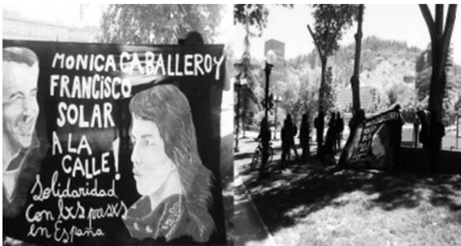
(Mitin solidario en las afueras de la Embajada de España en Chile. Diciembre 2013)

Por supuesto que partimos del hecho de que desde el enemigo no esperamos más que su hostilidad y represión. Por eso las siguientes reflexiones apuntan en el sentido de aportar al análisis para reflexionar/entender el momento y pasar a la acción desde la perspectiva insurrecta de la ofensiva antiautoritaria contra el poder.