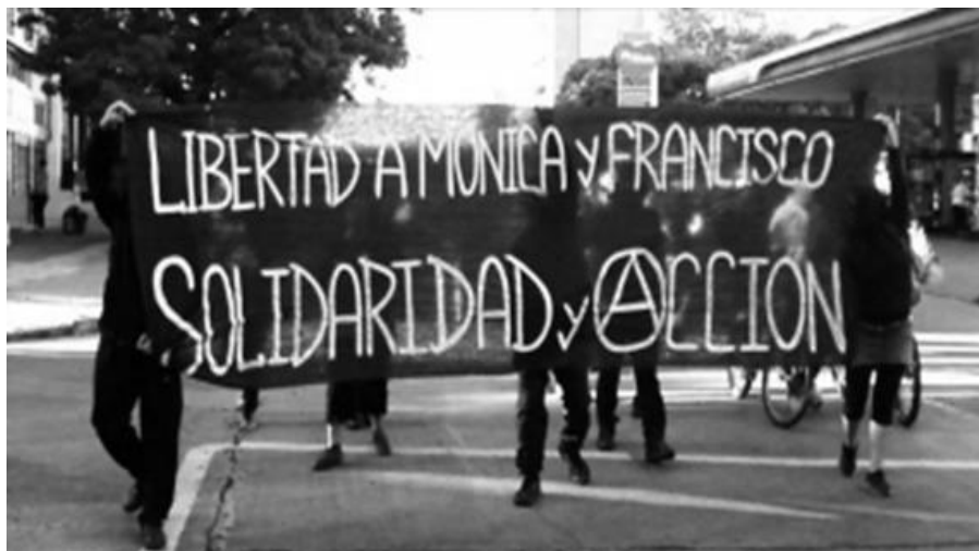
(Mitin en las afueras de la embajada de España en Uruguay. Diciembre 2013)