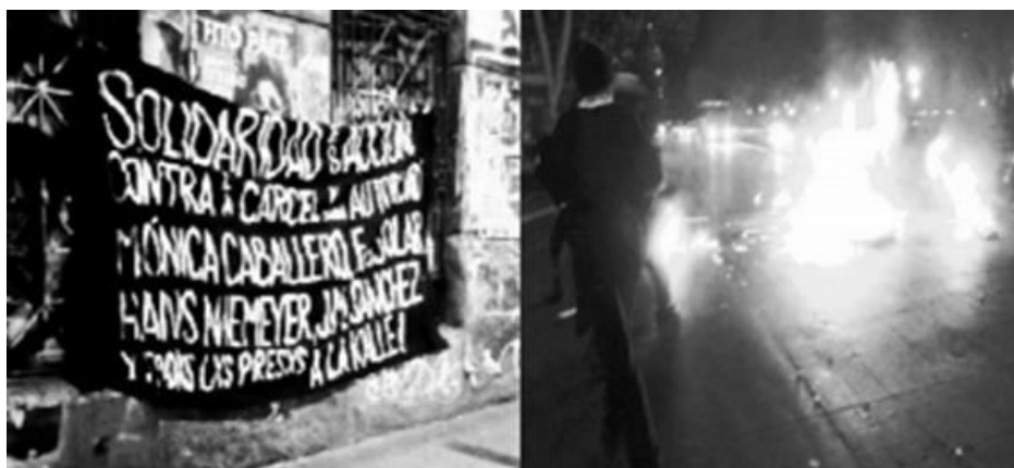
(Barricadas y propaganda en "La Alameda", principal avenida de Santiago, Chile. Diciembre 2013)